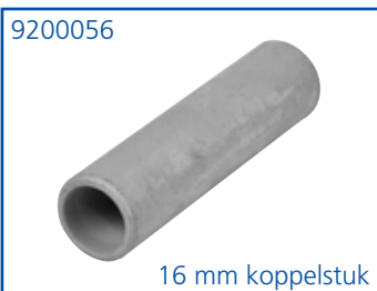
16 mm koppelstuk