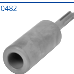
16 mm SDS adapter