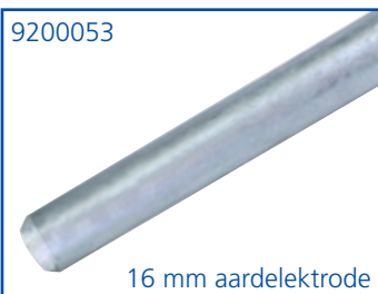
16 mm aardelektrode